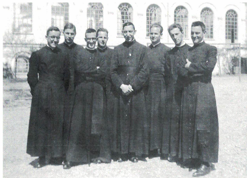
Im Helvetischen Seminar in Mailand